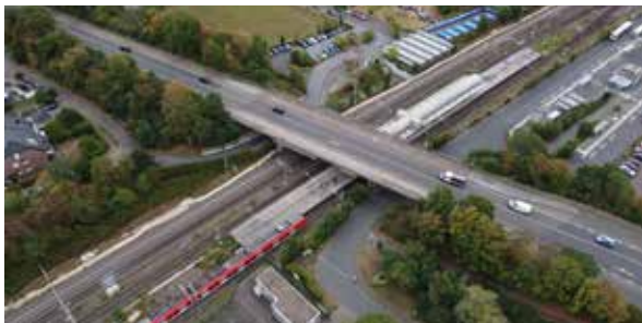
Die erste Brückenerneuerung erfolgt an der Knipprather Straße.

Der noch im vergangenen Jahr befürchtete Supergau von zwei Autobahnsperrungen in Kombination mit einer nicht passierbaren Brücke bleibt nach aktuellen Informationen aus. Denn in diesem Monat soll die Sperrung der Anschlussstelle Solingen der A3 in Fahrtrichtung Köln beendet sein. Die Spurreduzierung auf der A3 im Bereich der Anschlussstelle bleibt jedoch voraussichtlich noch bis Juli bestehen.