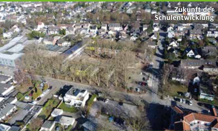
Zukunft der Schulentwicklung

Magazin der Stadt Langenfeld Rhld. Ausgabe 2/2026