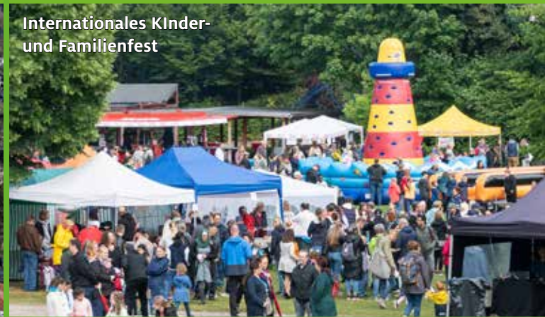
Internationales Kinder- und Familienfest