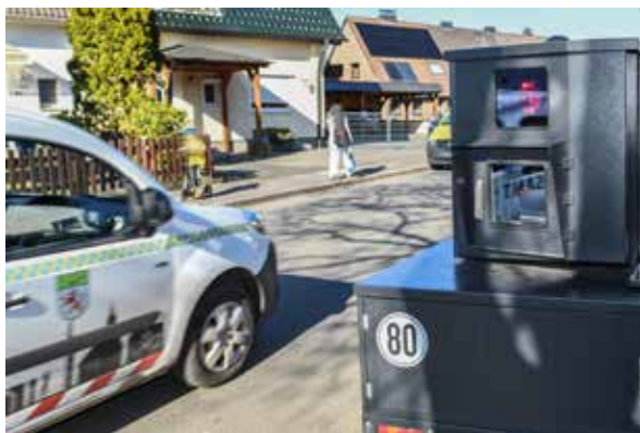
Seit September 2025 sorgt „Vivien“ für die lokale Geschwindigkeitsüberwachung auf dem Langenfelder Stadtgebiet.

Ein besonderer Baustein für mehr Bürgernähe sind regelmäßige Bürgersprechstunden des Ordnungsamtes direkt in den Stadtteilen. Die Mitarbeitenden stehen dabei vor Ort Rede und Antwort, nehmen Beschwerden und Hinweise auf und helfen unkompliziert wei-