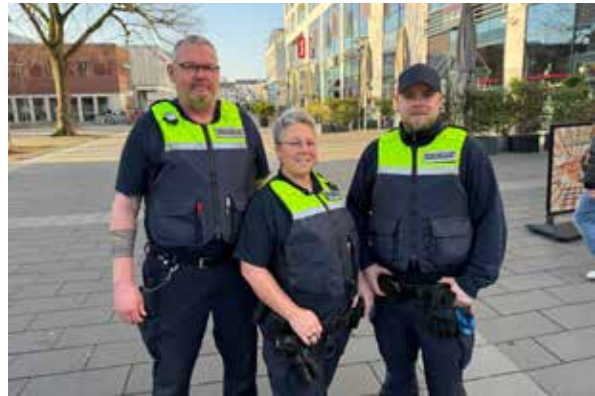
Die Aufstockung des städtischen Ordnungsdienstes gehört zu den tragenden Säulen der Sicherheitsoffensive der Stadt Langenfeld.