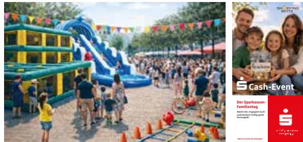
Neu im Festkalender: S-Cash-Event „Alles für die Ferienkasse“.

großen Spiel- und Fun-Arena warten unter anderem Fasadenklettern, Airbrush-Tattoos, eine Wasserrutsche und sportliche Mitmachangebote. Der Sparkassen Junior-Cup bringt Nachwuchsteams der Langenfelder Fußballvereine in einem fairen Wettbewerb zusammen, bei dem neben Pokalen auch Preisgelder für die Mannschaftskassen winken. Zudem erhalten bei Kids-live junge Musikerinnen und Musiker in Kooperation mit der Musikschule Langenfeld die Gelegenheit, als Straßenkünstler Bühnenerfahrung zu sammeln und eine kleine Gage für die eigene Ferienkasse zu erspielen. In der Fußgängerzone gibt es einen Kindersachen-Flohmarkt, bei dem Familien gebrauchten Spielzeugen, Kleidung und Büchern ein zweites Leben geben können – ganz im Sinne der Nachhaltigkeit. Vereine, Organisationen, Kitas und Schulen sind eingeladen, sich mit Mitmachaktionen und gastronomischen Angeboten zu beteiligen. Weitere Informationen und Anmeldemöglichkeiten: s-cash-event.de und langenfeld.de