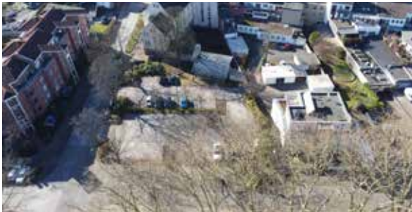
Parkplatz am Freiherr-vom-Stein-Haus.

Bereits im November hatte der Bürgermeister das Thema „Schulentwicklung“ zur Chefsache erklärt und eine Taskforce gegründet, um mit den zuständigen Experten der Verwaltung eine tragfähige Lösung zu erarbeiten. Dies ist auch gelungen.