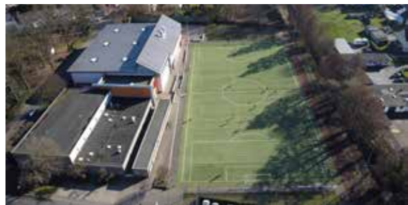
Sportplatz Hinter den Gärten.

Die Rheinische Post beschrieb das Konzept der Taskforce treffenderweise als „ausgeklügeltes Puzzle“. Es ist eines, dass in jedem Fall die Schullandschaft in Langenfeld ertüchtigen und modernisieren wird. In Kombination mit wechselnd dem ebenfalls bereits beschlossenen Ausbau am Konrad-Adenauer-Gymnasium wäre der Bedarf nach aktueller Schätzung der Schülerzahlen gedeckt.