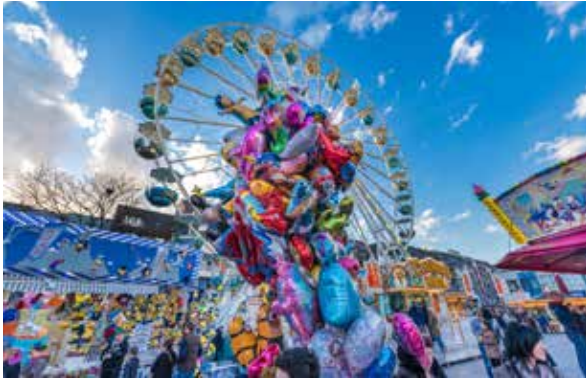
Den Auftakt zur Freiluftsaison macht vom 17. bis 20. April das Stadtfest mit verkaufsoffenem Sonntag.