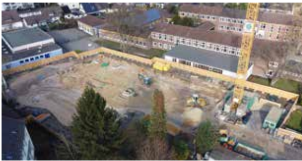
Aktuell erfolgt am Doppel-Schulstandort Fahlerweg der Ausbau des Offenen Ganztages.

der OGATA. Während die Peter-Härtling-Schule im Süden Langenfelds bereits auf der Zielgeraden angekommen ist, wo aktuell der Verwaltungsbau die Maßnahme komplettieren wird, weist am doppelten Schulstandort am Fahlerweg (Erich-Kästner-Schule und Christophorus-Schule) bereits ein großes Baufeld auf den neu entstehenden Offenen Ganztag vor Ort hin.