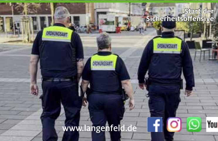
Start der Sicherheitsoffensive