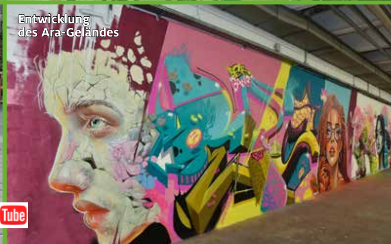
Entwicklung des Ara-Geländes