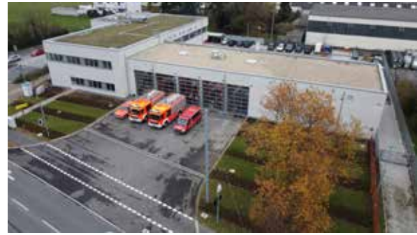
Das Feuerwehrhaus Nord.

Die Freiwilligenagentur ist Anlauf- und Koordinierungsstelle rund um das Ehrenamt. Sie bietet einen Überblick über die Möglichkeiten, sich freiwillig zu betätigen und hilft, eine passende Tätigkeit zu finden. Hier können Interessierte sich unverbindlich informieren und beraten lassen. Die Mitarbeiterinnen und Mitarbeiter der Agentur sind selbst ehrenamtlich tätig und freuen sich auf Besucherinnen und Besucher. Auch Organisationen, die freiwilliges Engagement nutzen wollen, bietet die Freiwilligenagentur Serviceleistungen. Unter anderem nimmt sie Stellenangebote auf und hilft bei der Suche von geeigneten Ehrenamtlichen.